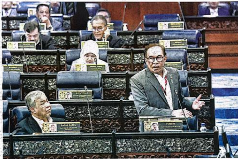
ANWAR ketika menjawab soalan pada sesi Pertanyaan-Pertanyaan Perdana Menteri pada Sidang Dewan Rakyat di Bangunan Parlimen, Kuala Lumpur semalam.

"Namun, pihak KKM dan BNM sedang menyelaraskan supaya kenaikan itu boleh dianggap munasabah dan tidak membebankan," katanya pada Sesi Pertanyaan-Pertanyaan Perdana Menteri di