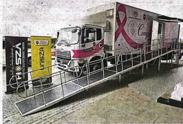
The mobile 3D mammogram truck was officially launched by Higher Education Minister Datuk Seri Dr Zambry Abd Kadir at the Putrajaya International Convention Centre during the Putrajaya Festival of Ideas.

Initiative will improve early detection for women in rural areas