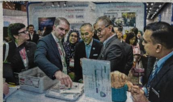
Dr Dzulkefly meluangkan masa melawat reruai pameran selepas merasmikan IMDEC 2024 di Kuala Lumpur, semalam.